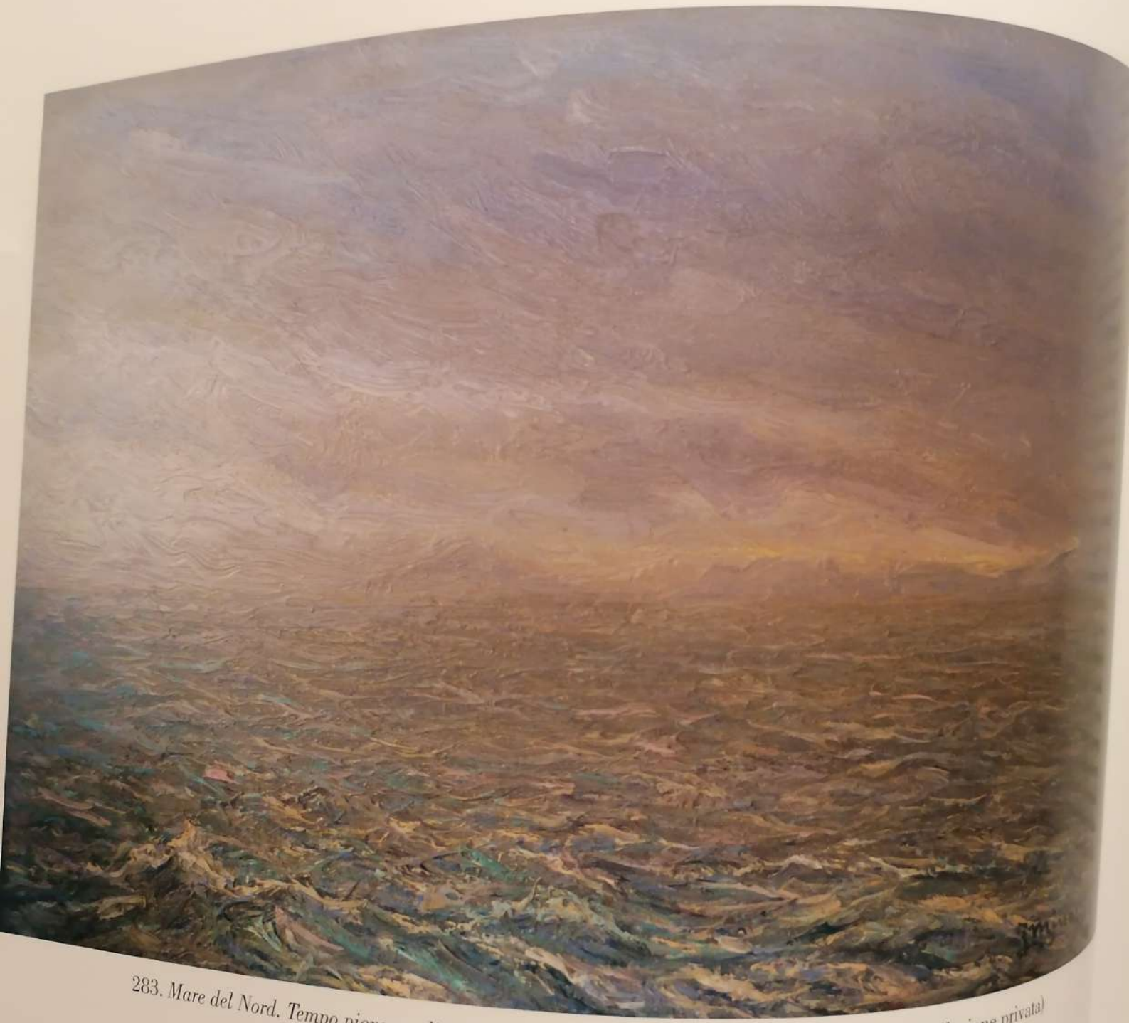
283. Mare del Nord. Tempo piovoso, olio su tavola, cm.21x29, firmato in basso a destra, (Collezione privata)