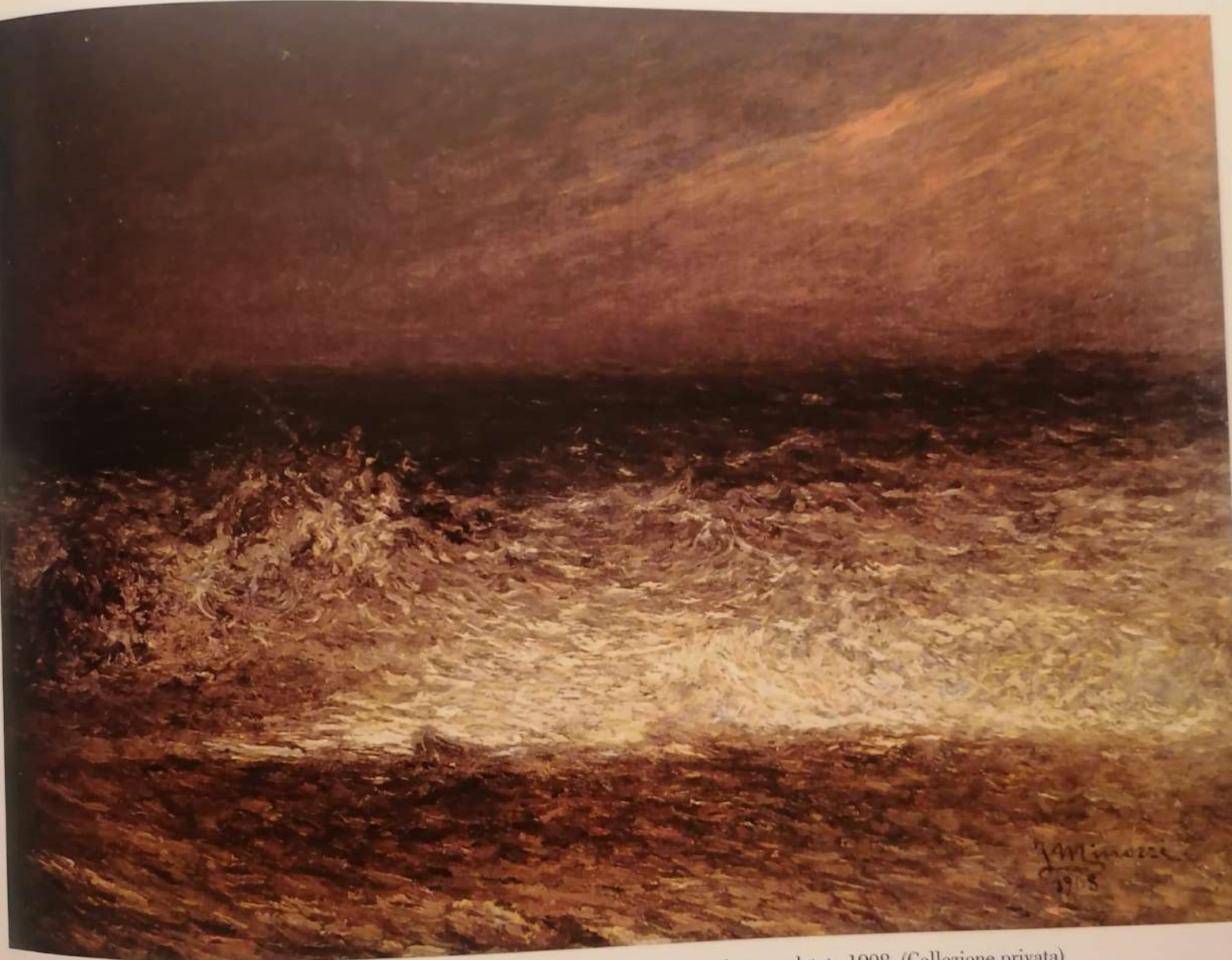
282. Raggio di luna , olio su tela, cm.55x75, firmato in basso a destra e datato 1908, (Collezione privata)