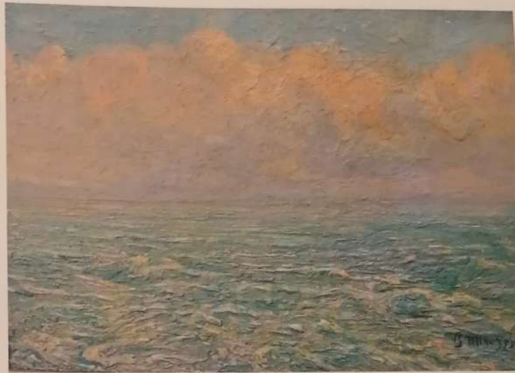
276. Tramonto 1906, olio su cartone, cm. 24x33, firmato in basso a destra, (Collezione privata)

tali opere venivano ancora riproposte, insieme ai paesaggi e alle molte marine dell'autore, nella mostra postuma tenuta a sei anni dalla sua scomparsa presso la Galleria del Duomo.