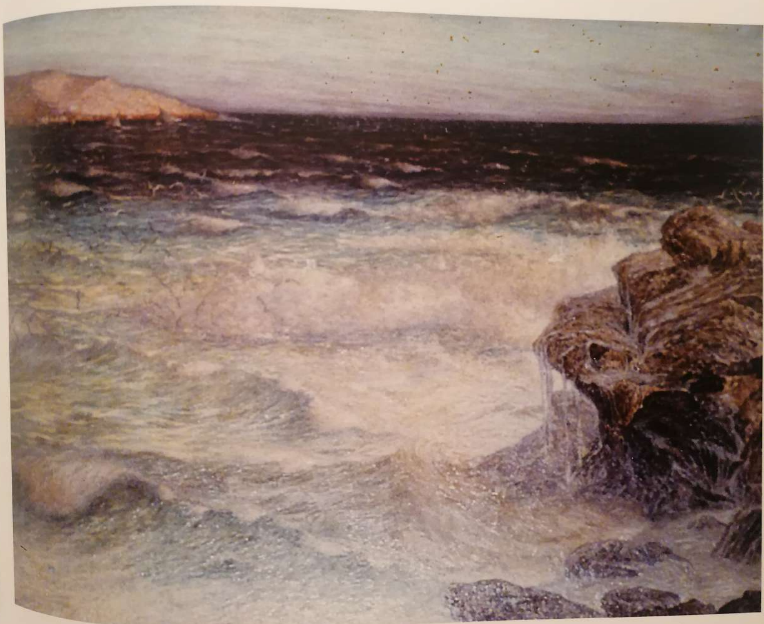
279. L'eterna sorgente (Cap Martin) , olio su tela, cm.110x148, al roverso: firmato e datato 1910-1917, (Collezione privata)