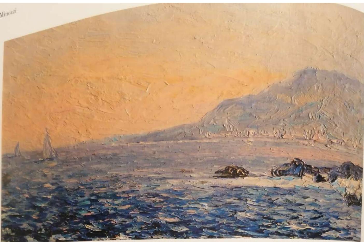
277. Marina a Montecarlo , olio su tavola, cm. 15x25, firmato in basso a sinistra, (Collezione privata)