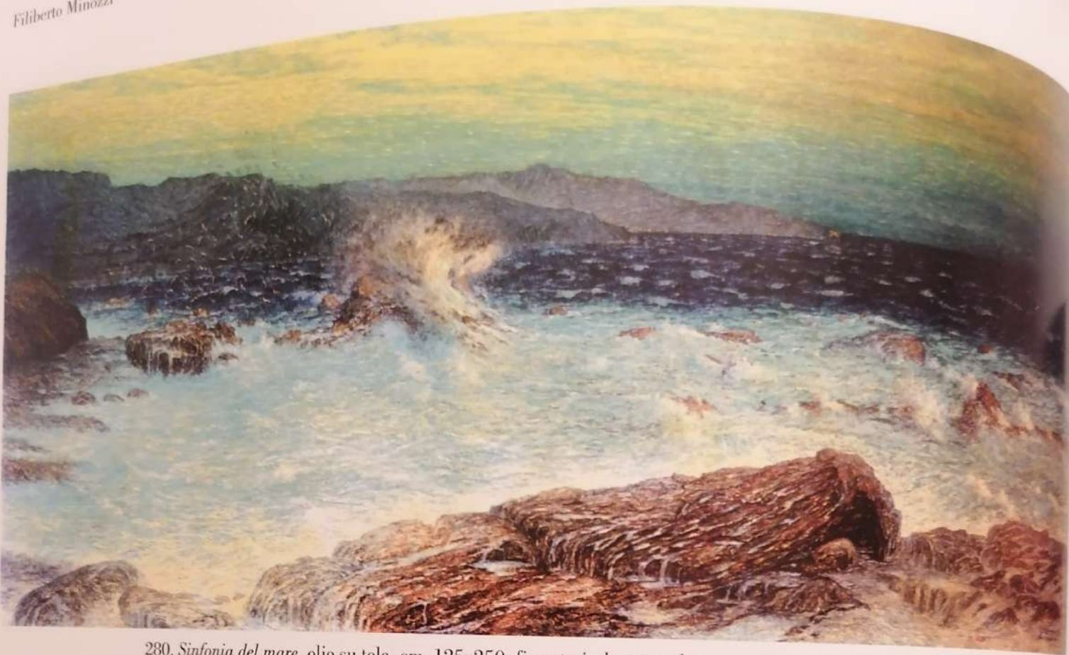
280. Sinfonia del mare , olio su tela, cm. 125x250, firmato in basso a destra e datato Bordighera 1909, (Galleria d'Arte Moderna Paolo e Adele Giannoni, Novara)